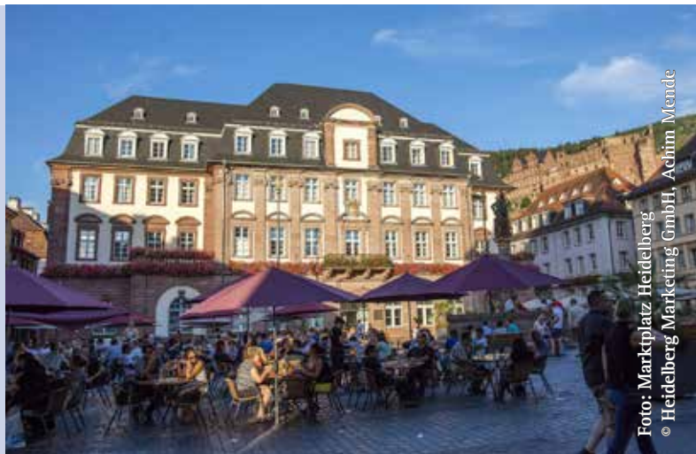
Foto: Marktplatz Heidelberg © Heidelberg Marketing GmbH, Achim Mende