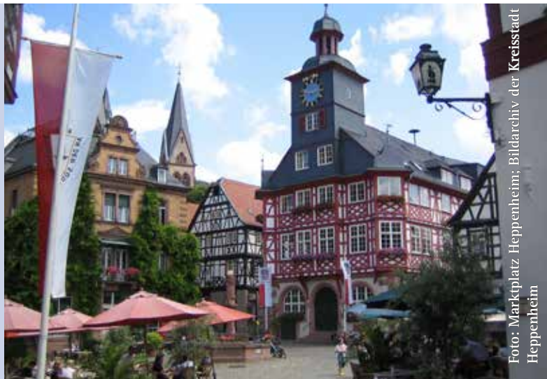
Foto: Marktplatz Heppenheim

Parkmöglichkeiten und ÖPNV: Parkmöglichkeiten in der Innenstadt: statischem Parkleitsystem folgen (9 Parkplätze) ÖPNV: IC Bahnhof von dort Linie 679 bis Haltestelle „Graben“ Busse: Busparkplatz am Parkhof - Parkhofstraße