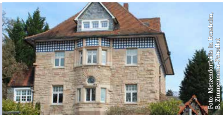
Foto: Metzendorfvilla in Bensheim

Für wen: Kunstinteressierte Wanderer, Rad- oder Autofahrer Informationen und Fach-Führungen: Metzendorf-Gesellschaft für Architektur und Denkmalschutz e.V., Bensheim info.metzendorfgesellschaft@googlemail.com www.metzendorfgesellschaft.de