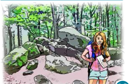
18 Kunst- und Panoramaweg