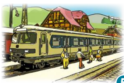
5 Fürther Miniaturwelten