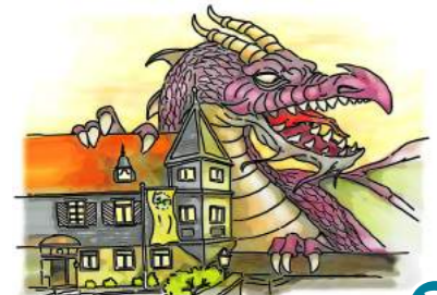
3 Deutsches Drachmuseum