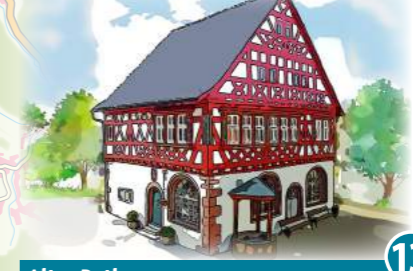
13 Altes Rathaus