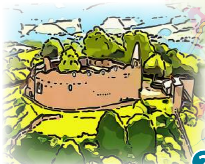
2 Burg Lindenfels