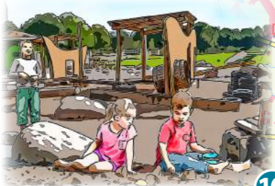
10 alla hopp! - Anlagen