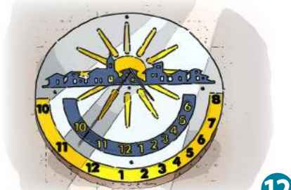
12 Dorf der Sonnenuhren