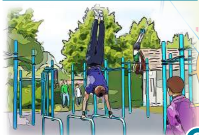
8 Street Workout Park