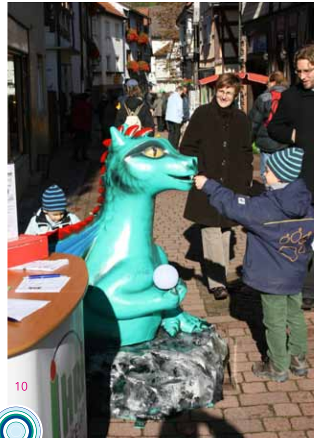
6+7+8+9: Eine Auswahl der bemalten Drachen (v. l.): Dragoon, Sigg, Kuni vom Kuhschwanzack und Luftikus